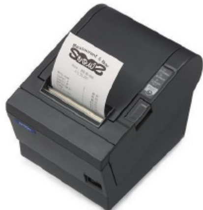
Auch in „Dark grey“ für jeden POS geeignet