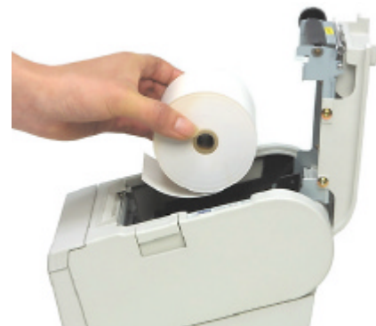
Klappe auf – Rolle rein – Klappe zu! Einfacher geht's nicht.