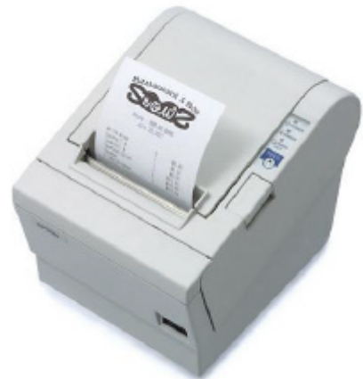
Die Thermodrucker-Referenz: EPSON TM-T88III

EPSON bietet mit dem TM-T88III die zuverlässige Drucklösung für alle Handelsbereiche und Dienstleistungsunternehmen, die hohen Wert auf schnellen, scharfen und nahezu lautlosen Druck legen.