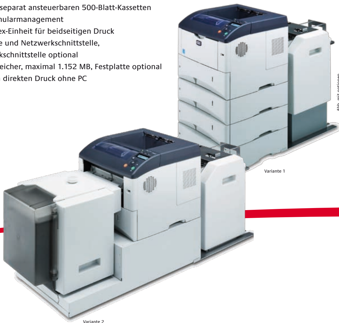
Abb. mit optionen.