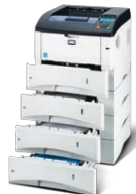
Abbildung enthält Optionen.

KYOCERA MITA DEUTSCHLAND GmbH – Otto-Hahn-Str.12 – D-40670 Meerbusch Infoline: 08 00 8 67 78 76 – Fax: +49 (0) 21 59 9 18 - 106 – www.kyoceramita.de