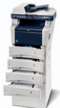
Abbildung zeigt FS-3140MFP mit Optionen